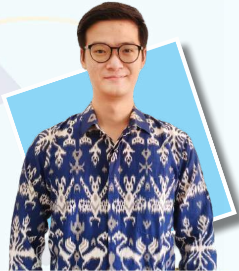
Yasuo Thunderstorm Huang

Gereja Kebangunan Kalam Allah Indonesia Jemaat Denpasar, Bali